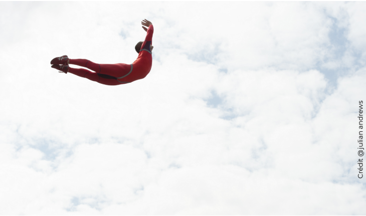
Le spectacle familial Parade à retrouver sur Arte.tv