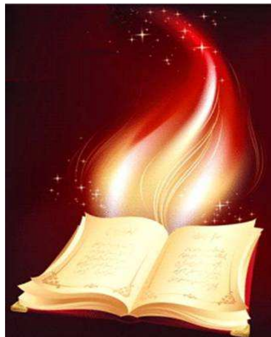
Illustration de couverture : Photographie de Viktoriya Yatskina