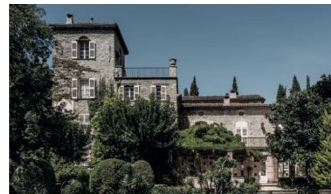
Facade du château de la Colle Noire

— Réservation au 01 83 81 93 40 ou à carreaudutemple.eu